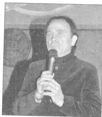
PRESIDENTE Roby Facchinetti

Tornando invece alla finale dei Casting, vale la pena di ricordare che i giovani musicisti, che si contenderanno uno